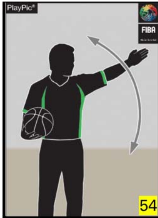
Рух рукою паралельно обмежувальній лінії