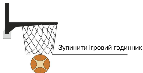
Рисунок 1 М'яч закинуто