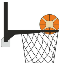
Рисунок 3 М'яч усередині кошика

31-20 Визначення. Є порушенням правила про перешкоду м'ячу, якщо гравець команди, що захищається, торкається м'яча, коли той перебуває всередині кошика.