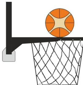
Рисунок 2 М'яч у контакті з кільцем

31-15 Визначення. Під час кидка з гри захисник чи нападник чинить порушення правила про перешкоду м'ячу, коли гравець торкається кошика або щита в той момент, коли м'яч перебуває в контакті з кільцем і ще зберігає можливість увійти в кошик.