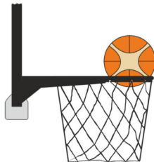
Рисунок 3 М'яч усередині кошика

31-21 Визначення. Є порушенням правила про перешкоду м'ячу, якщо гравець команди, що захищається, торкається м'яча, коли той перебуває всередині кошика.