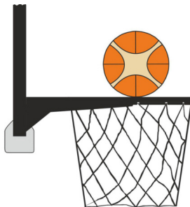
Рисунок 2 М'яч у контакті з кільцем

31-15 Визначення. Під час кидка з гри захисник чи нападник чинить порушення правила про перешкоду м'ячу, коли гравець торкається кошика або щита в той момент, коли м'яч перебуває в контакті з кільцем і ще зберігає можливість увійти в кошик.